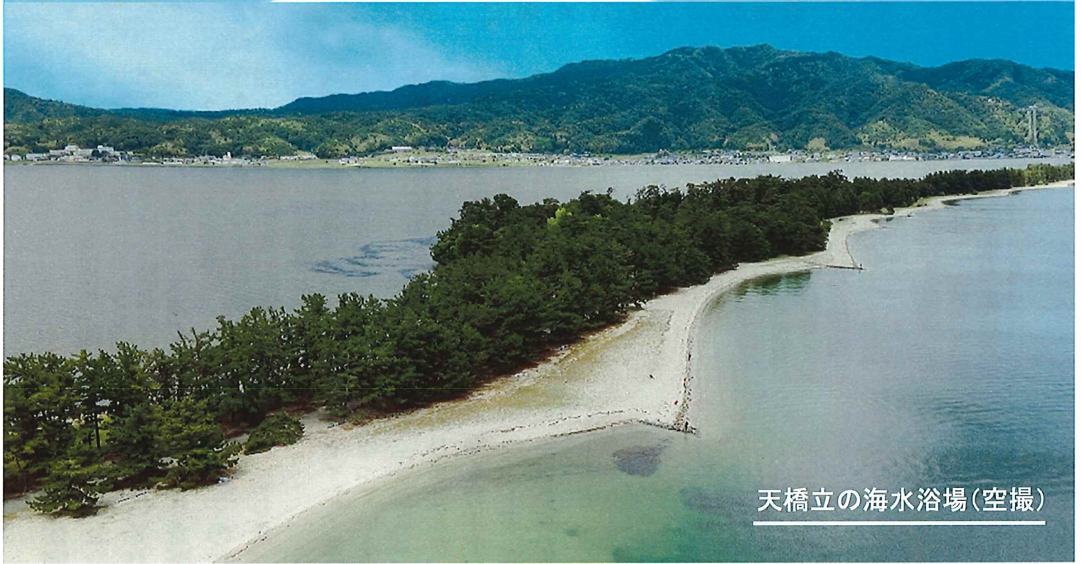
天橋立の海水浴場(空撮)

アスリートの皆様には金メダルを連発してもらい、コロナ禍を追っ払ってもらいましょう！