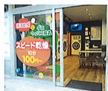
リビングランドリー大森西7丁目店 大田区大森西7-8-22