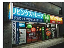
リビングランドリー大森東邦医大 通り店 大田区大森西3-12-30