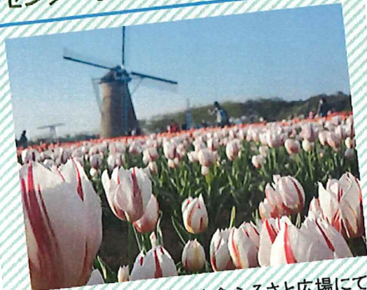
千葉県 佐倉ふるさと広場にて チューリップの絨毯は最高でした♪