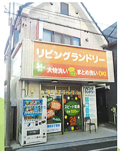
リビングランドリー新蒲田3丁目店外観 道塚小学校の目の前です

24時間営業です リビングランドリーは3店舗とも、24時間営業となっております。お忙しい皆様も時間を気にせず、いつでも洗濯から乾燥まで一度に完結しますので、大変便利です。