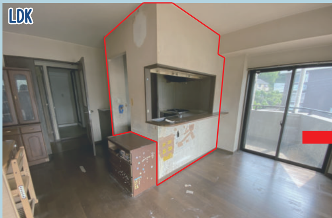
LDK カウンターキッチンは壁に囲われて圧迫感がありそうです…。ご家族でご入居の方は、お子様の様子も目が届きにくい見えます。

Instagramでは、他にも色々なリノベーション工事を載せています！是非チェックしてみてください！