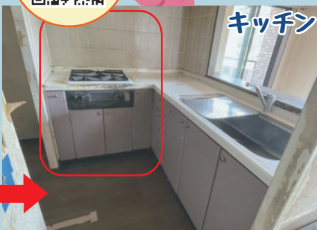
キッチン 玄関 コンロ正面はリビングが全く見えません。