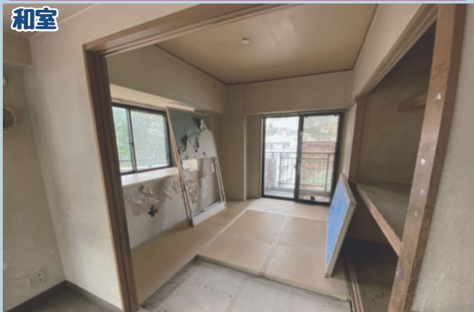
和室 畳は色あせてしまい、襖や壁も落書きなどの汚れが目立ちます。和室から洋室へ変更し、LDKと繋がるようなお部屋にしていきます！