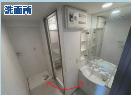
洗面所 お風呂 洗面化粧台と洗濯機の位置をチェンジします！