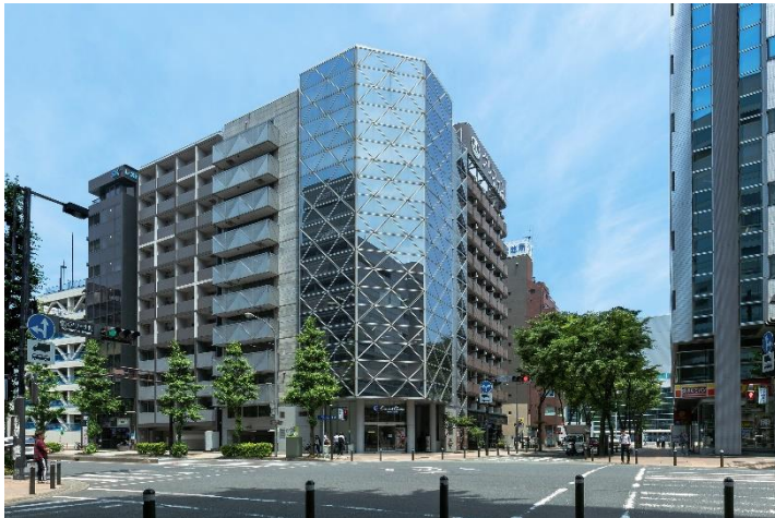
写真：「横浜アリーナ前」交差点に建つKCビル。リビングライフ新横浜センターはこのビルの6階にあります。