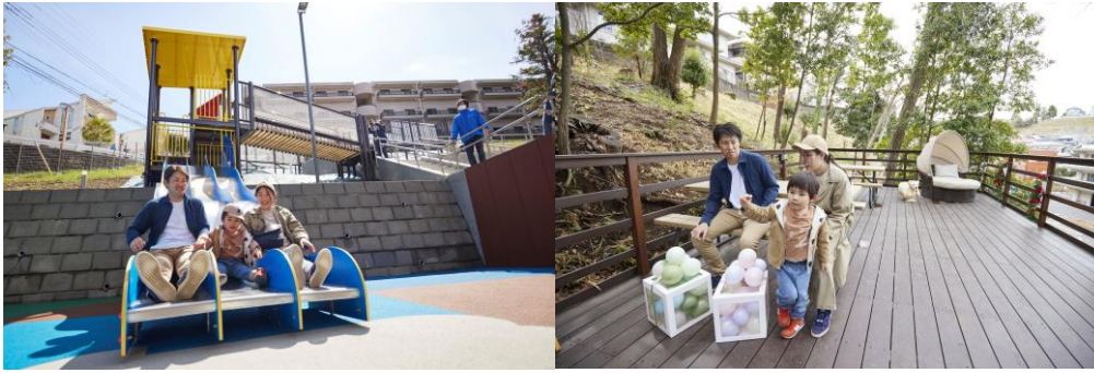
写真左上：アスレチック、右上：ウッドデッキテラス