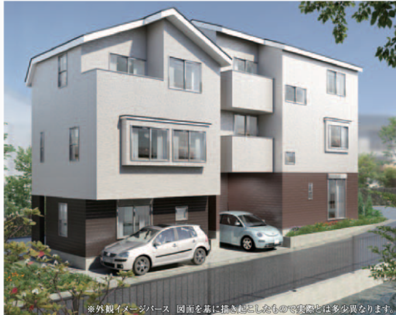
※外観イメージパース 図面を基に描き起こしたもので実際とは多少異なります。