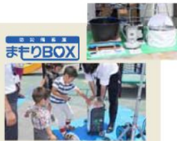
GOOD DESIGN AWARD 2013年度受賞

同社の住宅には災害時、建物は大丈夫でも、ライフラインが寸断されたときを想定し、「住民が3日間、明るく、暖かく、安全に暮らせる」よう、大型防災備品を備えた防災備蓄庫「まもりBOX」を設置（一部除く）。いざというときにスムーズに使えるよう「防災備品の利用体験会・防災訓練」を開催し、住民の防災意識を高めると同時にコミュニティの形成も支援している。こうした取り組みにより、2013年度グッドデザイン賞を受賞した。