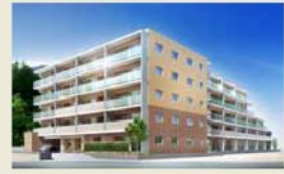
ライフレビュー大磯