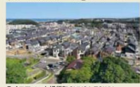
ライフアソート横須賀 SUNSA TOWN